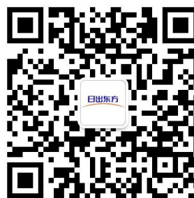
关注日出东方公众号 云上参观展厅